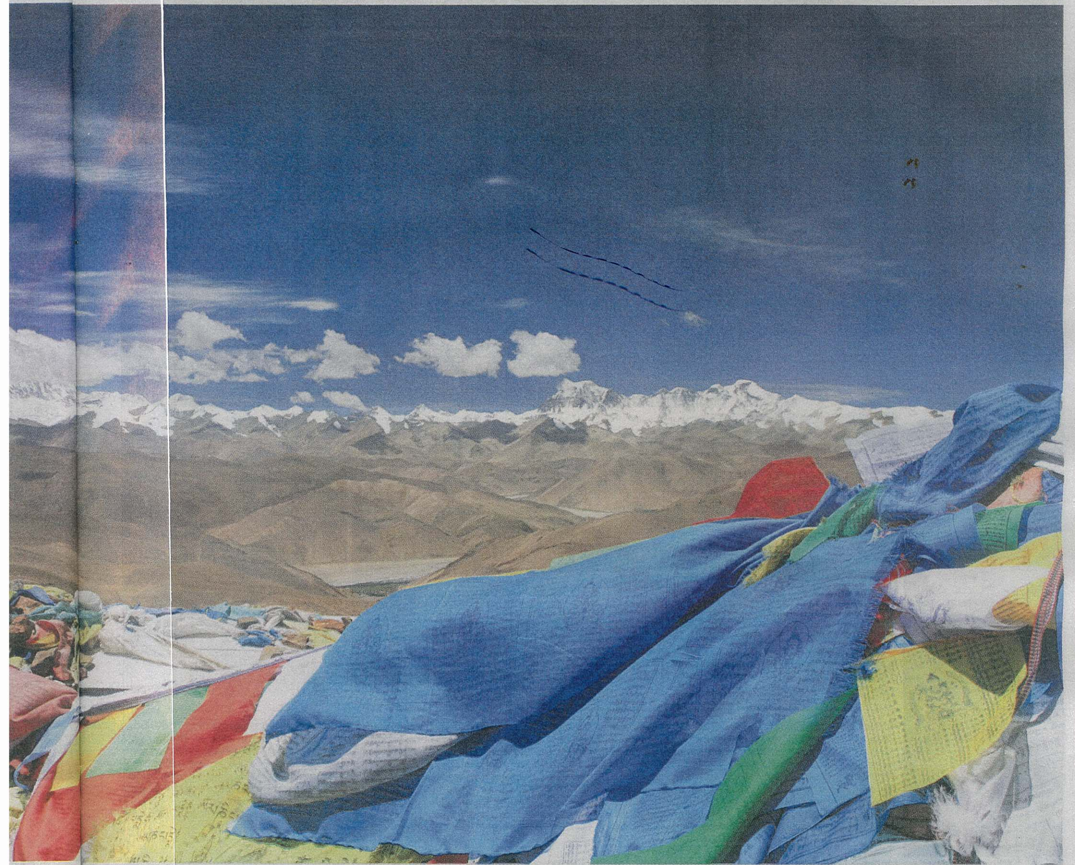
Historiske bønneflagg, bak ser vi Mount Everest og det noe lavere fjellet Cho Oyu.